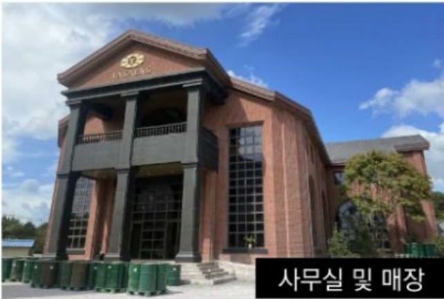
사무실 및 매장